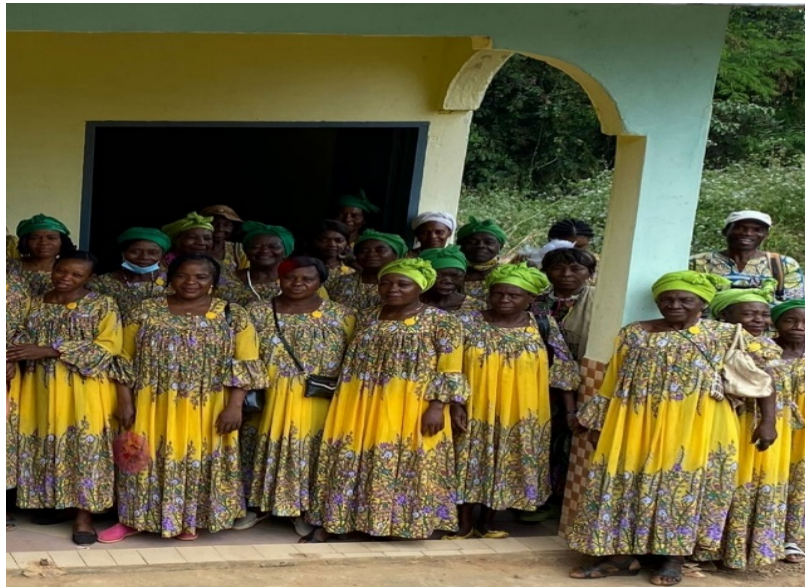
Dones de l'associació AFADAAN

També treballem plegats amb AFADAN (Association des Femmes Actives d'arrondissement de Nyanon) . Aquesta associació agrupa a més de 200 dones de la comarca i part de les seves dirigents formen part de la Junta directiva d'AMMNY. Les dones són el veritable motor per al desenvolupament de la zona ja que són molt dinàmiques, organitzades i responsables.